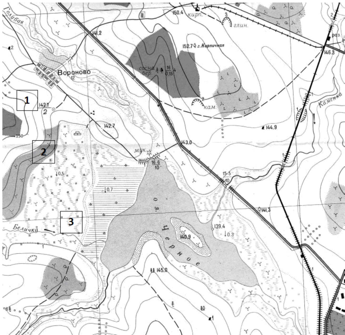
Сплошные горизонталы проведены через 2,5 метра Балтийская система высот