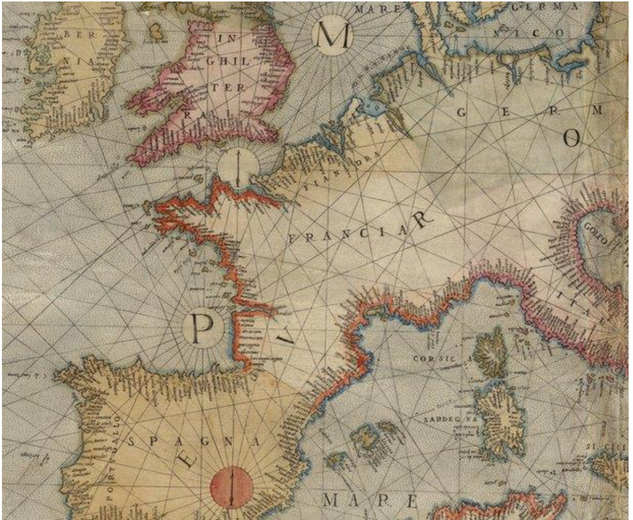
Рисунок – Карта-портулан Паоло Форлани