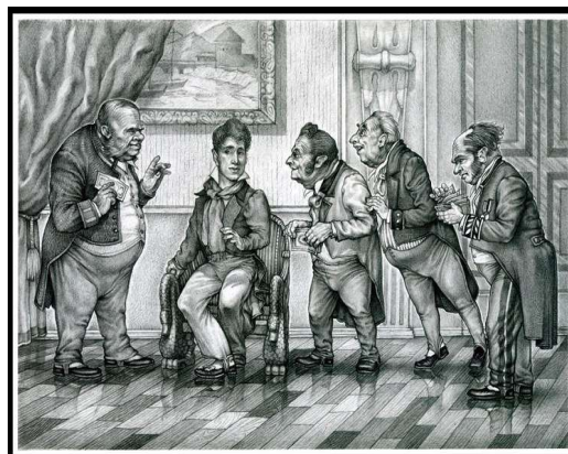
2. К.А. Савицкий, 1900 год