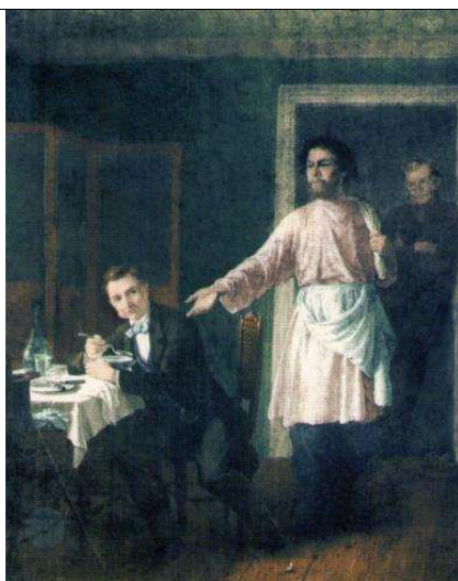
5. Д.Н. Кардовский, 1933 год