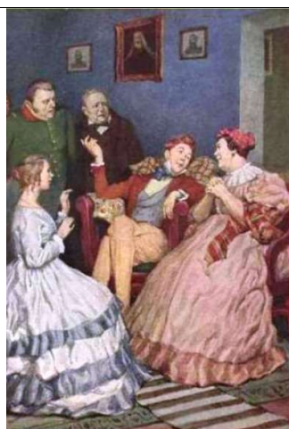
6. П.М. Боклевский, 1863 год