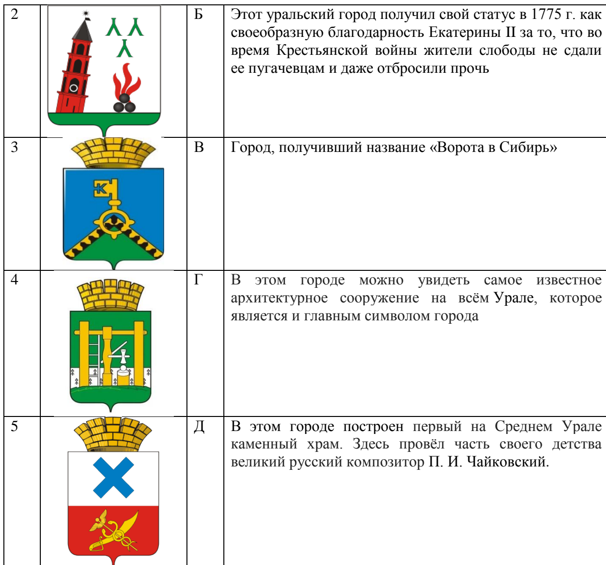
Таблица для ответов: