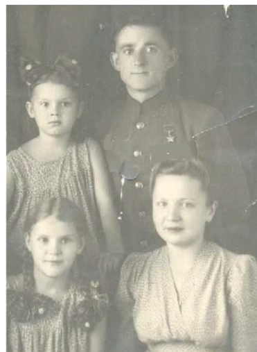
2. 1932 г./1939 г.