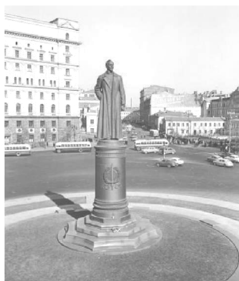
6. 1985 г./1992 г.