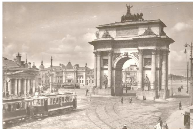
4. 1934 г./1938 г.