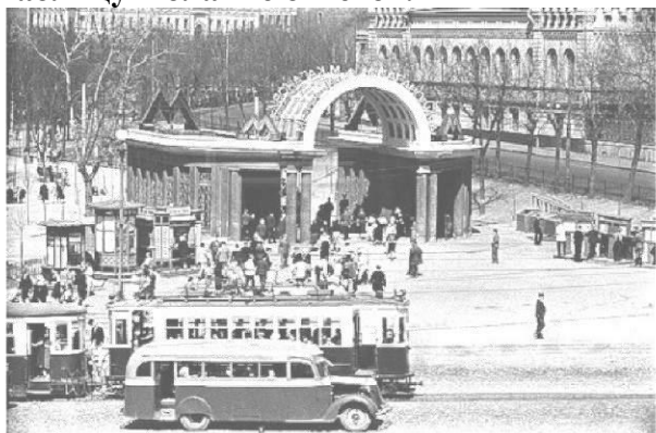
1. 1930 г./1936 г.

Задание 9. Внимательно рассмотрите фотографии, используя их для максимального извлечения информации. Из двух указанных дат выберите ту, которая НЕ может быть отнесена к изображению, и кратко объясните мотив вашего решения. Ответ внесите в таблицу в бланке ответов.