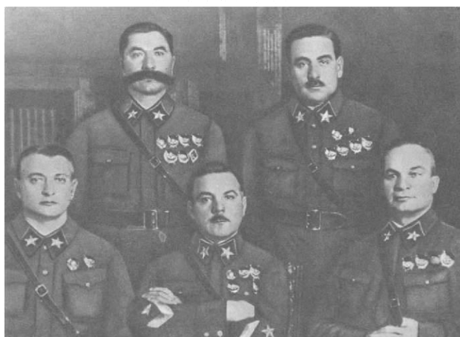
5. 1935 г./1940 г.