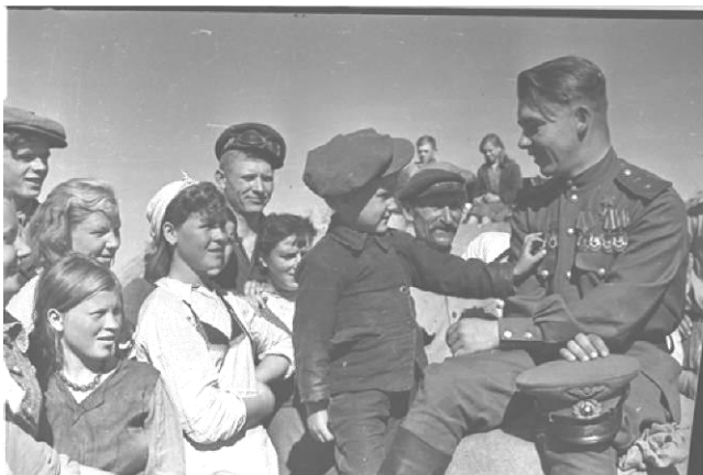
3. 1942 г./1944 г.