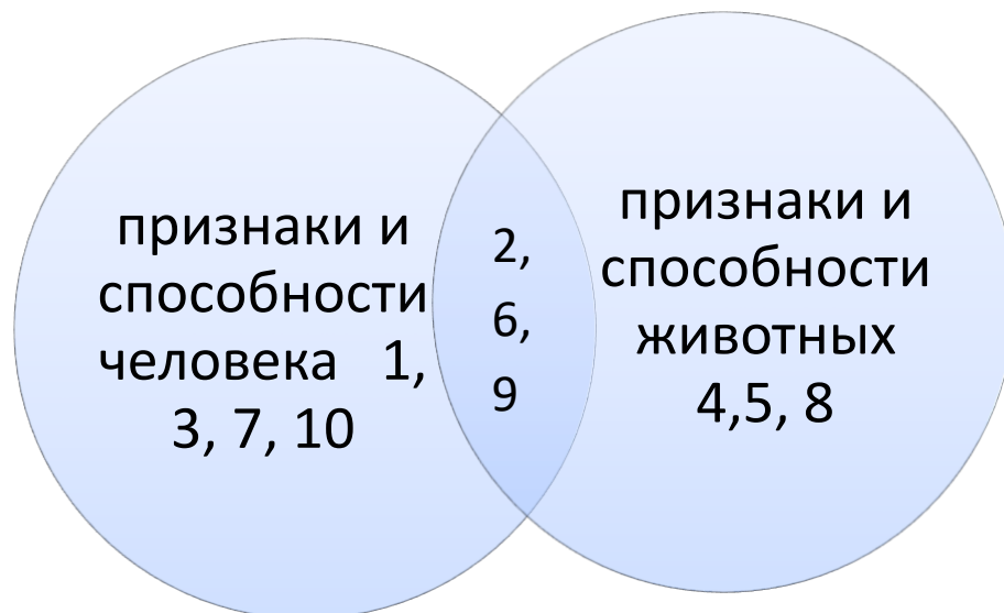
схема правильного ответа:

Задание 1. Проставьте в нужную часть схемы номера тех способностей или признаков, которые относятся к данному объему понятия. (10 баллов)