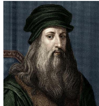
Леонардо да Винчи Галилей не изобретал телескоп