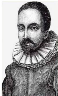
Иоанн Липперсгей (Ханс) Липперсге не изобрел телескоп