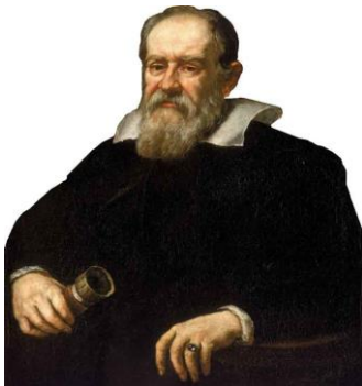
Галилео Галилей Галилей изобрёл телескоп

Перед Вами три портрета учёных, которых считают изобретателями телескопа. Рядом с портретами есть надписи. По крайней мере две из них ложны. Вам необходимо определить, кто из этих учёных на самом деле является изобретателем телескопа. Свой ответ обоснуйте.