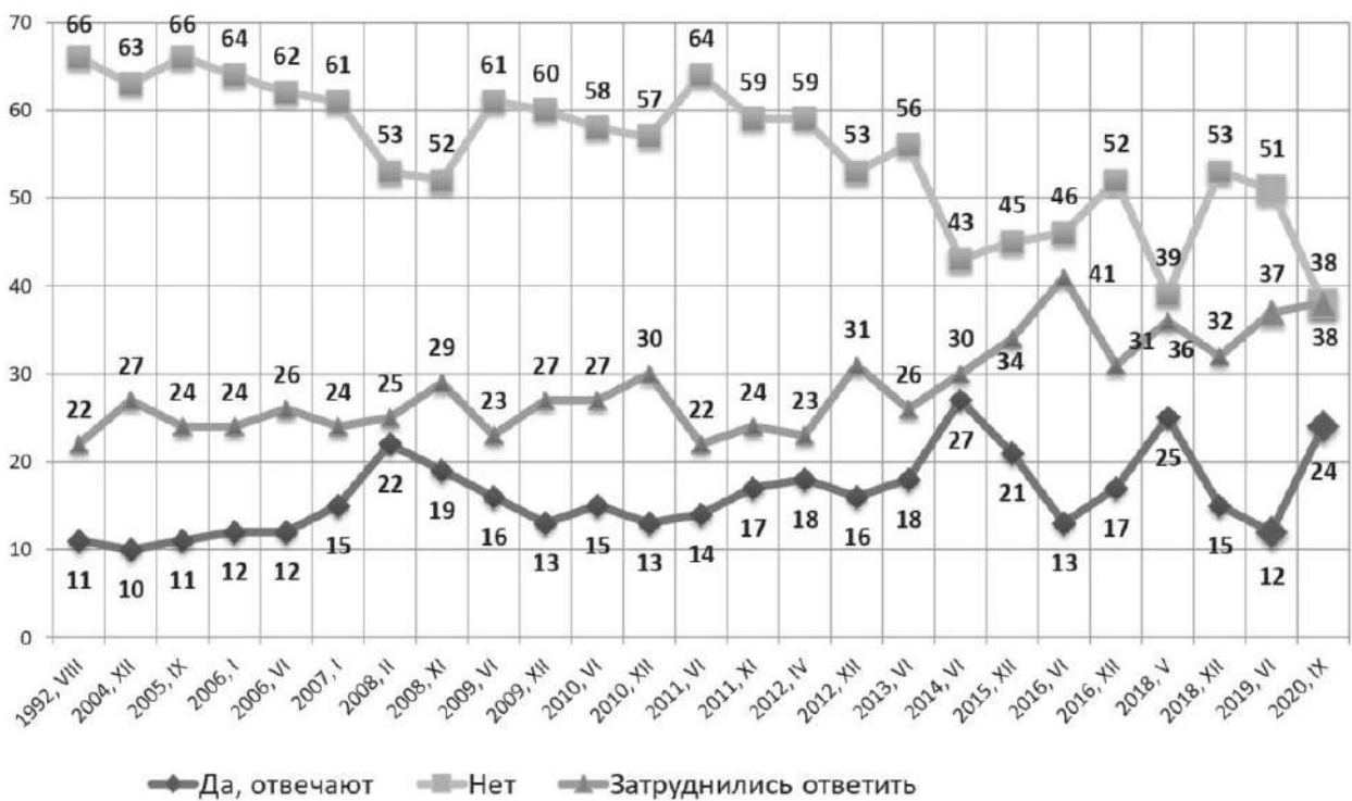
Рис. 2. Мнение респондентов о том, отвечают или нет проводимые экономические преобразования интересам большинства населения нашей страны, 1992–2020 гг. (РФ, % от числа опрошенных)