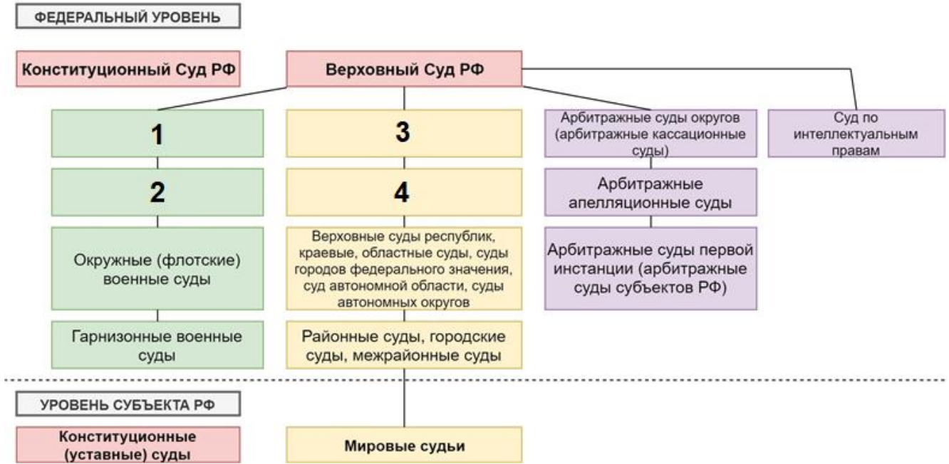
СУДЕБНАЯ СИСТЕМА РФ (схема)

17. Запишите названия судебных органов, пропущенные в схеме, напротив цифр, соответствующих номеру (по 2 балла за каждое верно указанное название):