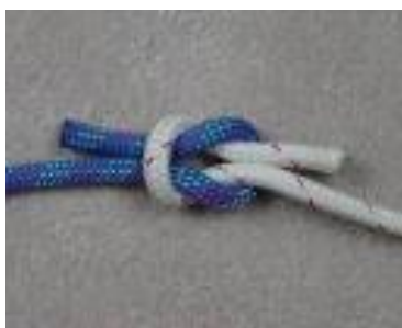
Вариант 2. Узел «ПРЯМОЙ»