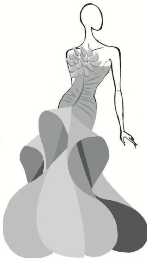
2. Романтический (фантазийный)