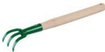
Рис. 1. Ручной рыхлитель с деревянной ручкой

26. Творческое задание ( выполняется на отдельном листе ): разработайте конструкцию ручного рыхлителя с деревянной ручкой (рис. 1) и опишите процесс изготовления.