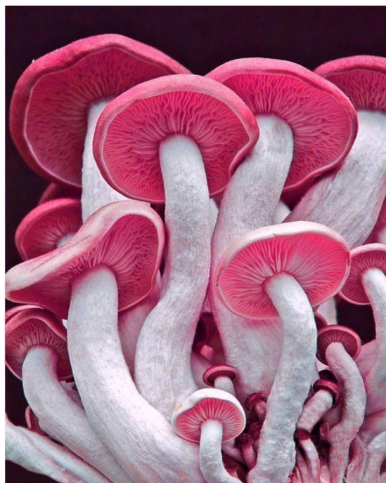
Рис. 1. Лаковица аметистовая