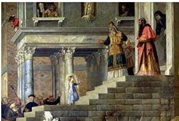
Титиан. Введение Марии во храм.

Могут быть приведены и другие произведения искусства с доминированием голубого цвета.