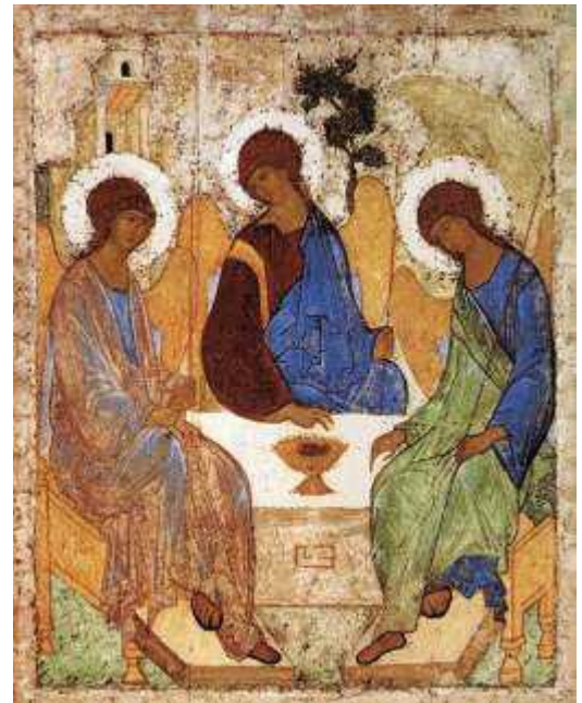
А. Рублев. Троица.