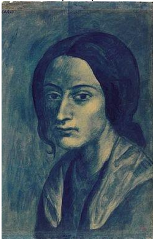
«Женщина с пучком волос» - картина «голубого» периода Пабло Пикассо