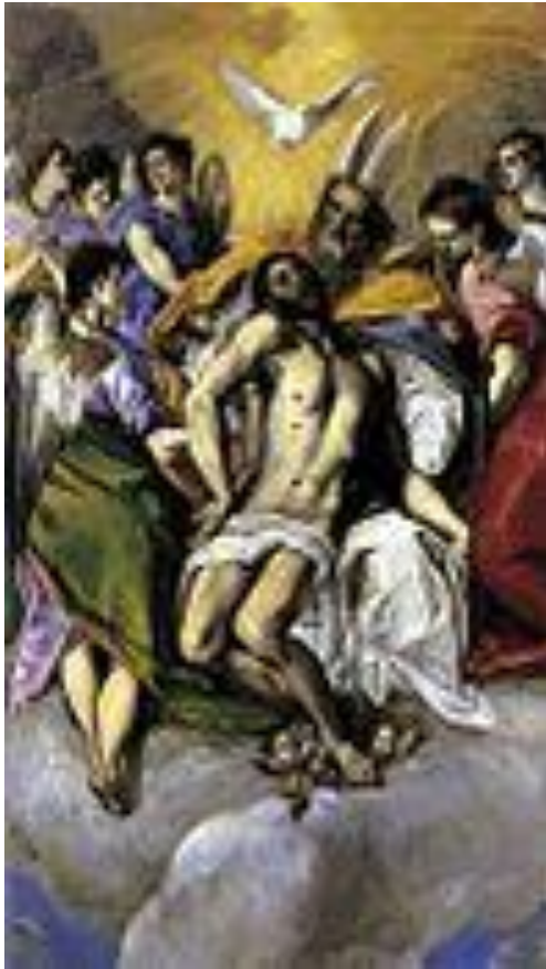
Эль Греко. Троица.