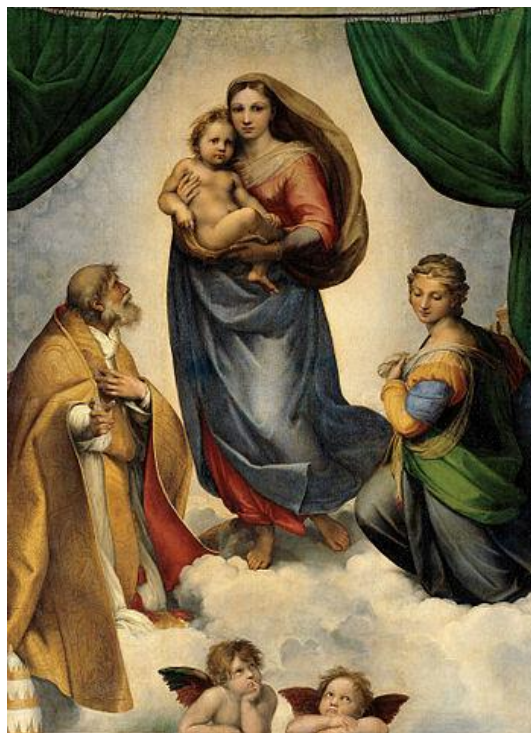
Рафаэль. Сикстинская Мадонна.