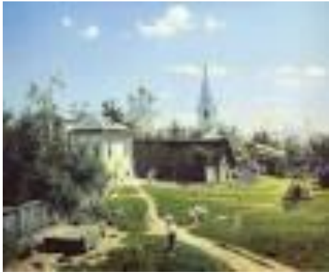
В. Д.Поленов. «Московский дворик»

Описание, эмоциональная основа и вывод должны подчеркивать следующие значения голубого цвета в искусстве: