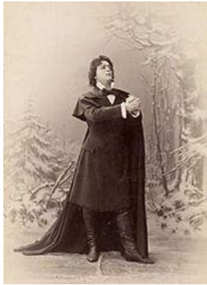
4. Л. В. Собинов в роли Ленского