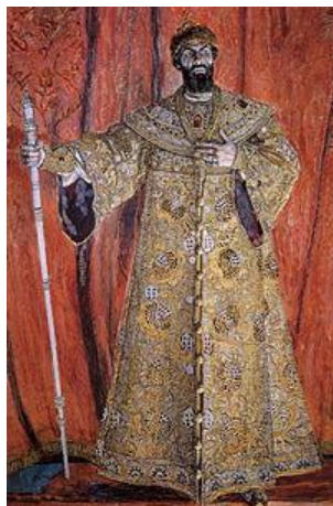
9. М. П. Мусоргский. «Борис Годунов»