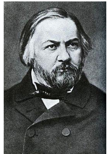
3. М. И. Глинка