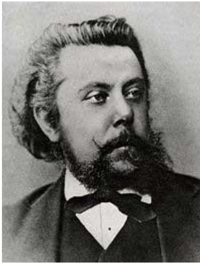
1. М. П. Мусоргский