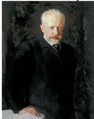
6. П. И. Чайковский