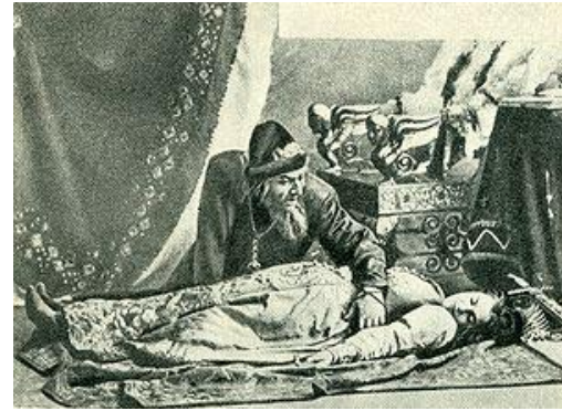
5. Ф. И. Шаляпин в роли Ивана Грозного в опере «Псковитянка» Н. А. Римского-Крсакова.