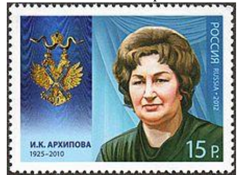
8. Почтовая марка, Россия 2012 г.