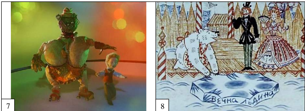
Таблица для ответа 1