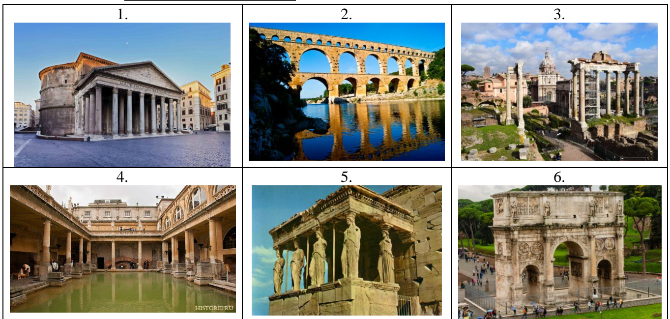
Таблица к заданию 1.

ЫЕМТР РУФОМ КААР ККВДЕУА ХЭЕЙТЕРНО ЕТАОННП