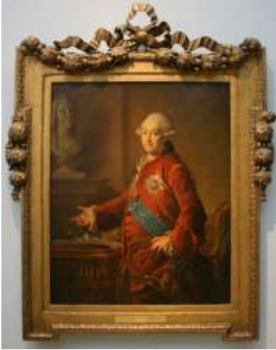
1. Д. Г. Левицкий Портрет князя А.М. Голицына. 1772 г.