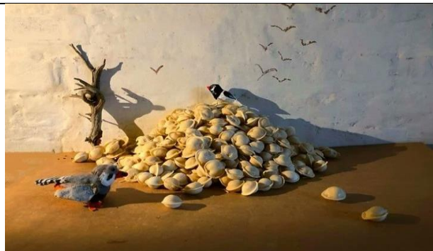
Автор: Василий Васильевич Верещагин Название картины: «Апофеоз войны»