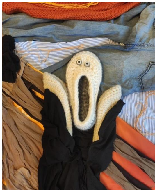
Автор: Эдвард Мунк Название картины: «Крик»