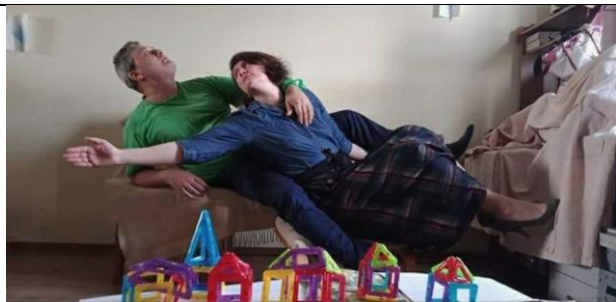
Автор: Марк Захарович Шагал Название картины: «Над городом»