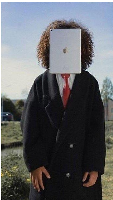
Автор: Рене Магритт Название картины: «Сын человеческий»