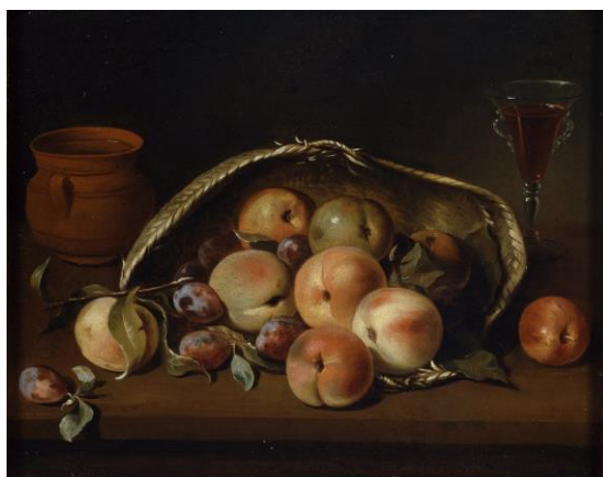
Рис.1. Название: _____

Напишите авторов и названия картин, представленных на рисунках: