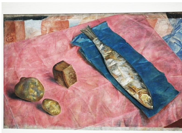
Рис. 2 Название _____