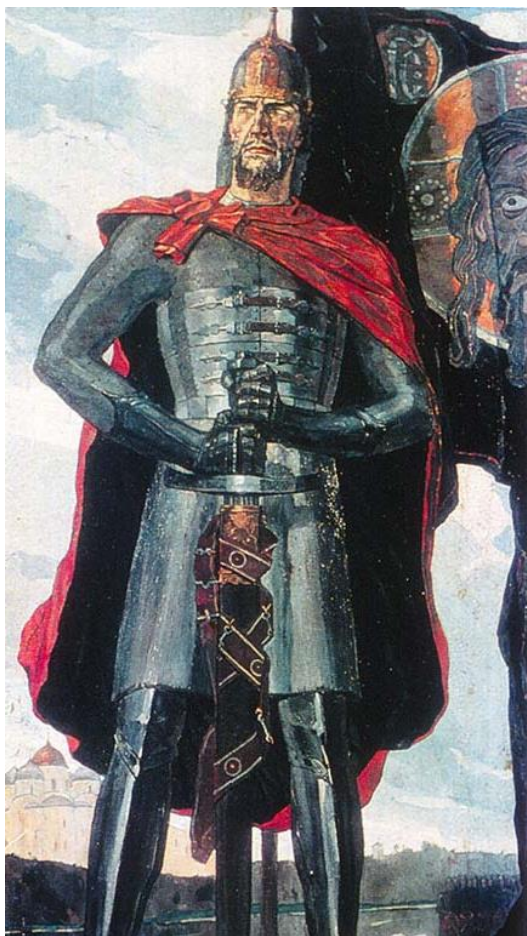
Павел Дмитриевич Корин

Внимательно рассмотрите представленные репродукции картин П.Д. Корина и Н.К. Рериха. Прочитайте текст. Ответьте на вопросы.