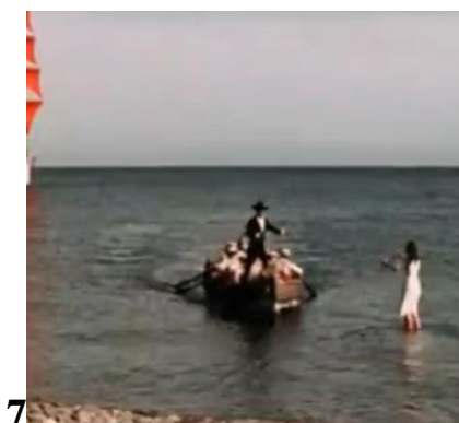
Таблица к заданию 2