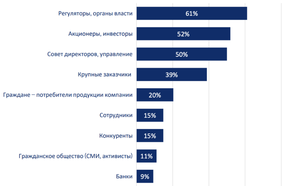
Рис. 2: Данные института государственного и муниципального управления НИУ ВШЭ.

Получается, что ESG-повестка в России меняется и расширяется, она никуда не пропадает и остается востребованной, пока страна находится в торговых отношениях с многочисленными партнёрами.