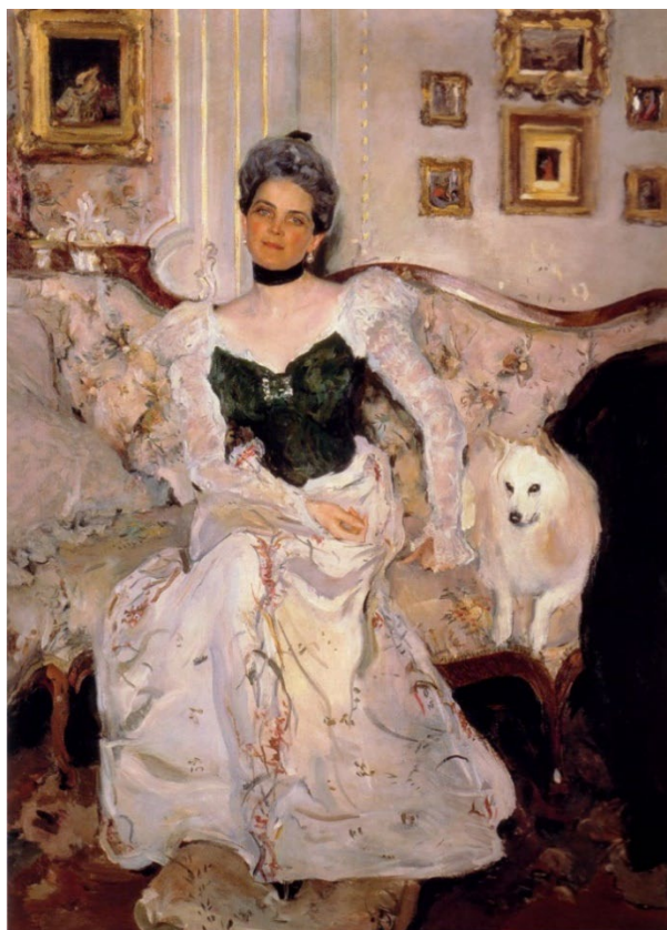
в) Валентин Серов. Портрет Зинаиды Юсуповой. 1902