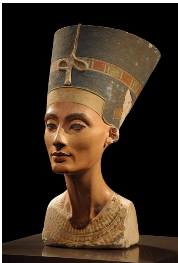
г) Бюст Нефертити. Ок. 1351—1334 до н. э.