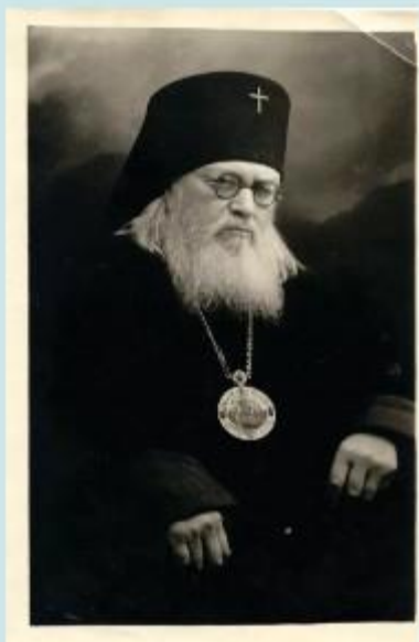
Архиепископ Лука (Войно-Ясенецкий)