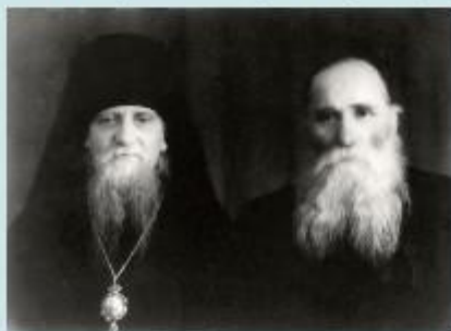
Епископ Афанасий Ковровский (Сахаров)