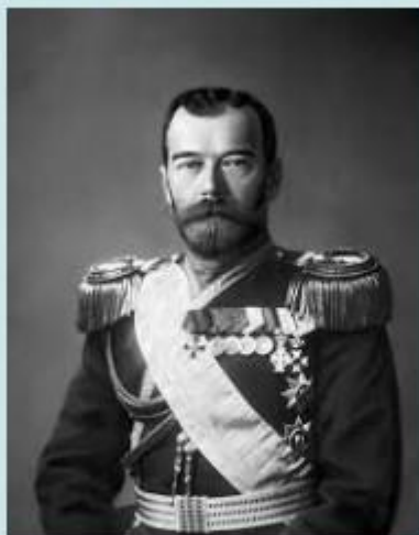
Император Николай II