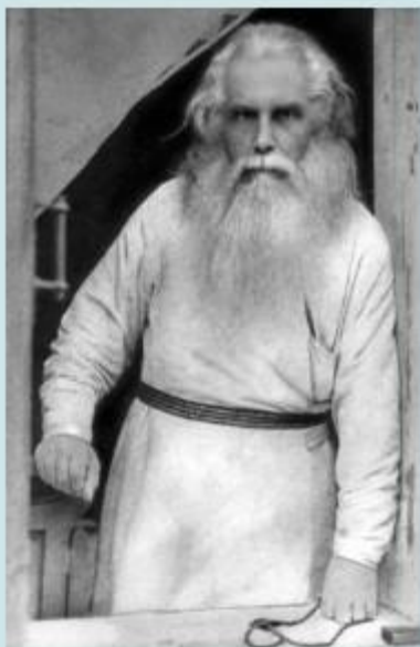
Митрополит Кирилл (Смирнов)