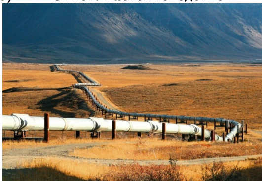
Ответ: Трубопровод (Трубопроводный транспорт)