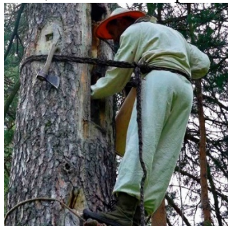
Ответ: Бортничество (Бортовое пчеловодство)

Расшифруйте по представленным картинкам понятия социально-экономической географии и составьте из первой буквы каждого понятия название города России, где располагается третья по мощности ГЭС страны.