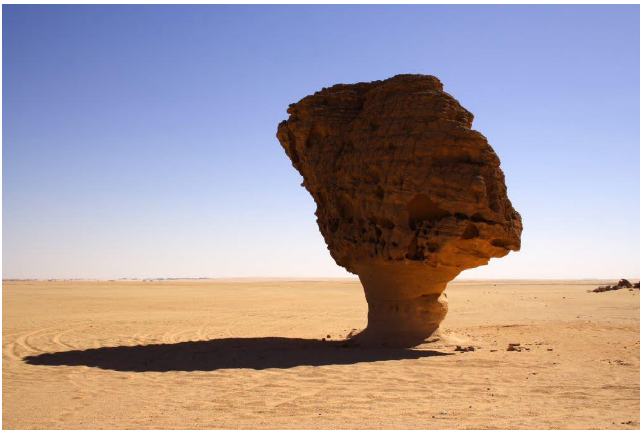
Рис. 1. Грибообразная скала на плато Гильф-Кебир, Египет.

5. Расположите месторождения горючих полезных ископаемых с востока на запад: Ромашкинское, Ангаро-Ленское, Приобское, Астраханское.