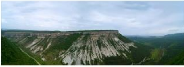
С. Слоистые горы