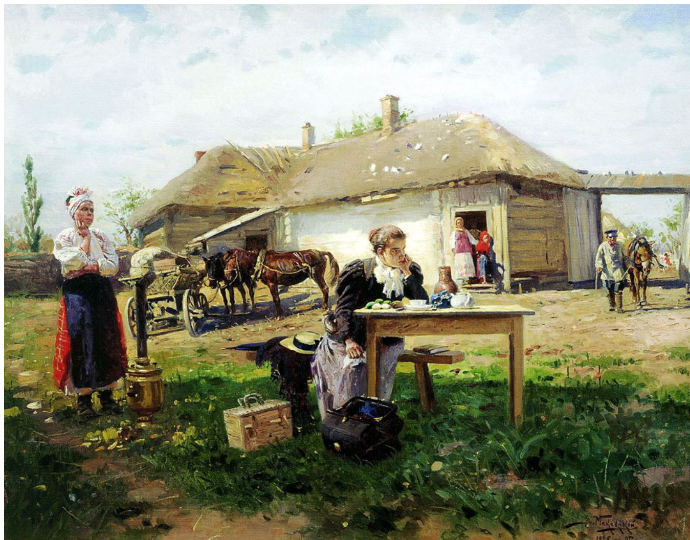
В. Маковский «Приезд учительницы в деревню», 1897, Государственная Третьяковская галерея

Максимальное количество баллов за задание - 16 баллов .