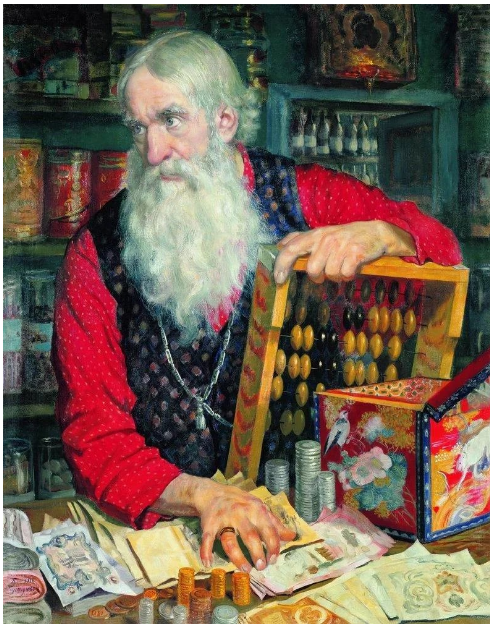
Б. Кустодиев. «Купец, считающий деньги» 1918

Максимальное количество баллов за задание - 16 баллов .