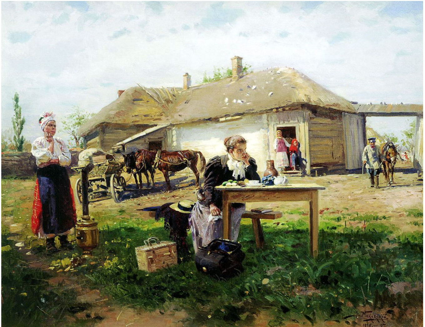
В. Маковский «Приезд учительницы в деревню», 1897, Государственная Третьяковская галерея

Максимальное количество баллов за задание - 16 баллов.