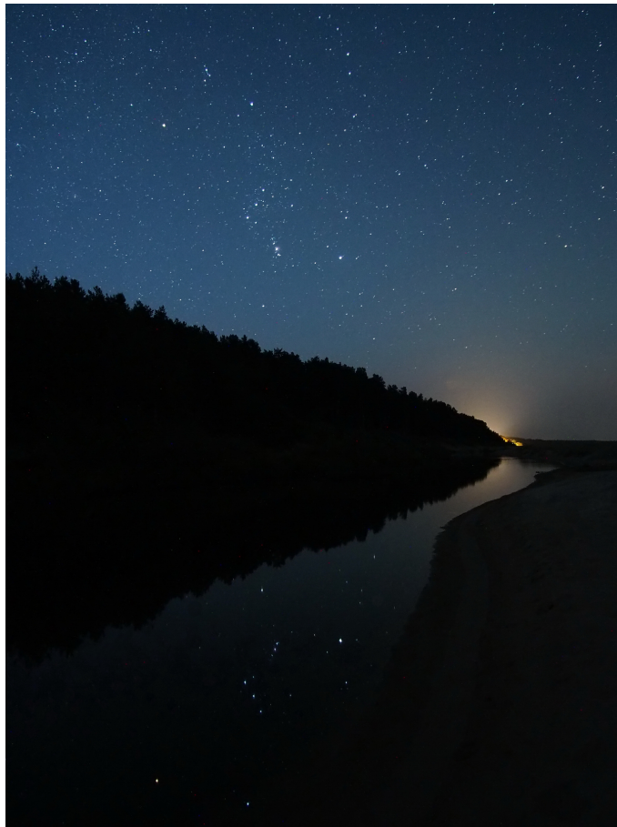
Вид на восток, утро сентября 2

На фотографии запечатлён вид на восток сентябрьским утром. Давайте полюбуемся ночным небом и его отражением в речной воде!