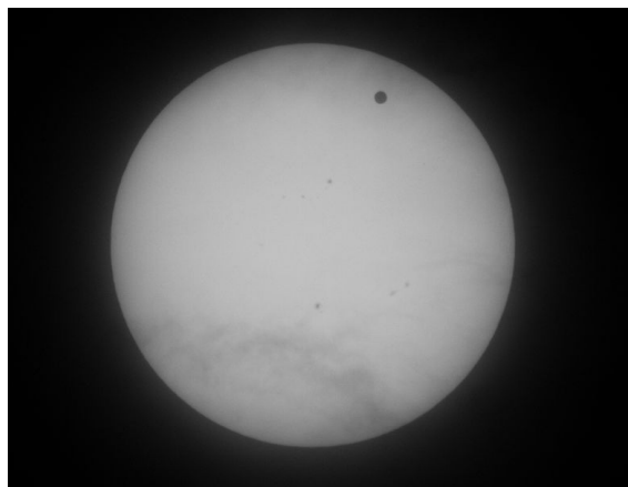
Прохождение Венеры по диску Солнца (Москва, 2012) 1