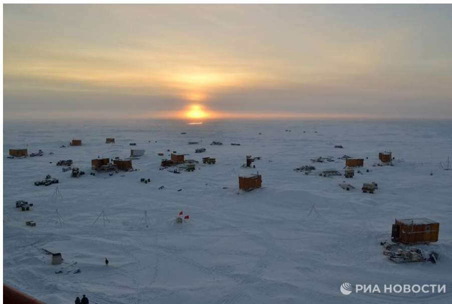
Арктический пейзаж 5

На Северном полюсе Земли в некоторый день восходит Солнце.