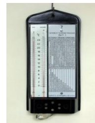
д) Гигрометр психометрический

10. Укажите столицу страны, с которой у России есть морская граница.