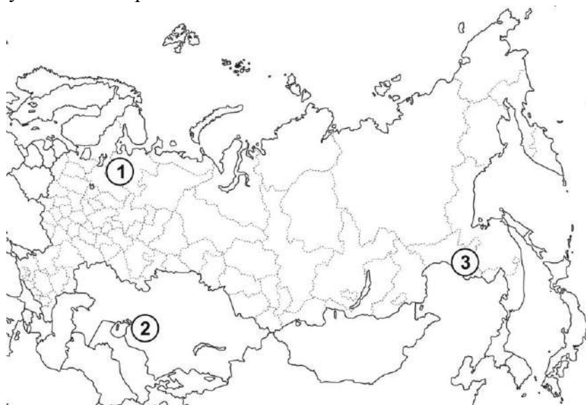
ТАБЛИЦА ОТВЕТОВ НА ЗАДАНИЕ 4