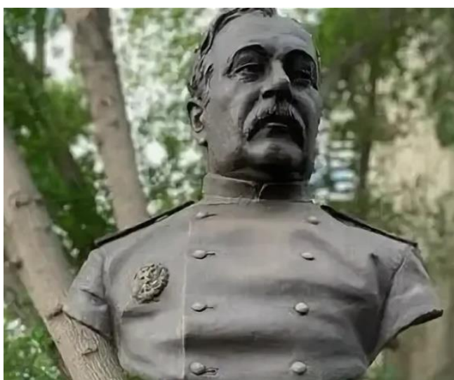
Бюст М.В. Певцову в г. Омске на ул. Певцова

Максимальное количество баллов за задание: 15.