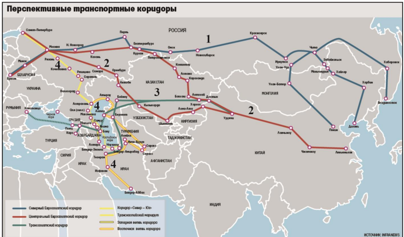
Рис.1. Перспективные транспортные коридоры

2) Как называется коридор, обозначенный цифрой 4, какие страны предполагается связать с его помощью, какое состояние коридора в настоящее время?