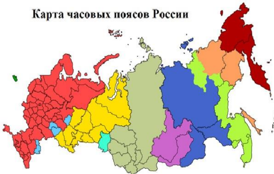
Карта часовых поясов России

9. Выберите из списка пару объектов, географически не связанных друг с другом: