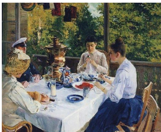
К. Коровин. «За чайным столом»