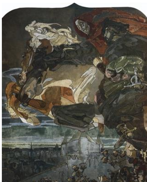
М. Врубель. «Полёт Фауста и Мефистофеля»