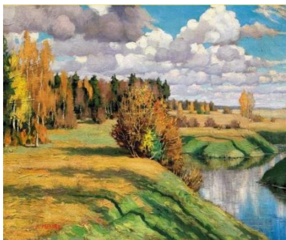
А. Рылов. «Прозрачное утро осени»