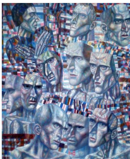
П. Филонов. «Ударники»