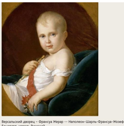
Версальский дворец – Франсуа Жерар -- Наполеон-Шарль-Франсуа-Жозеф Бонапарт, король Римский

3.1. В одном из эпизодов «Войны и мира» Л. Толстой раскрывает смысл этого термина, описывая картину 1812 года: «Весьма красивый курчавый мальчик, со взглядом, похожим на взгляд Христа в Сикстинской мадонне, изображён был играющим в бильбоке. Шар представлял земной шар, а палочка в другой руке изображала скипетр».