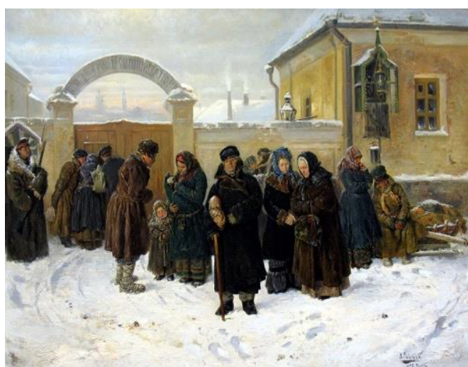
В.Е. Маковский. «Ожидание у острога»