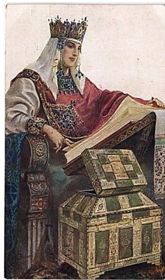
С.С. Соломко. «Апраксия Королевична»