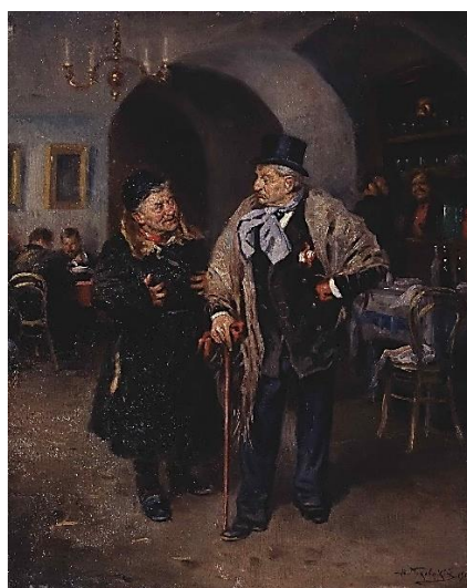
В.Е. Маковский. «Не припомню»