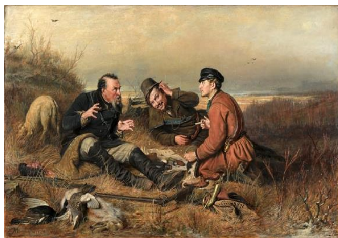
В.Г. Перов. «Охотники на привале»