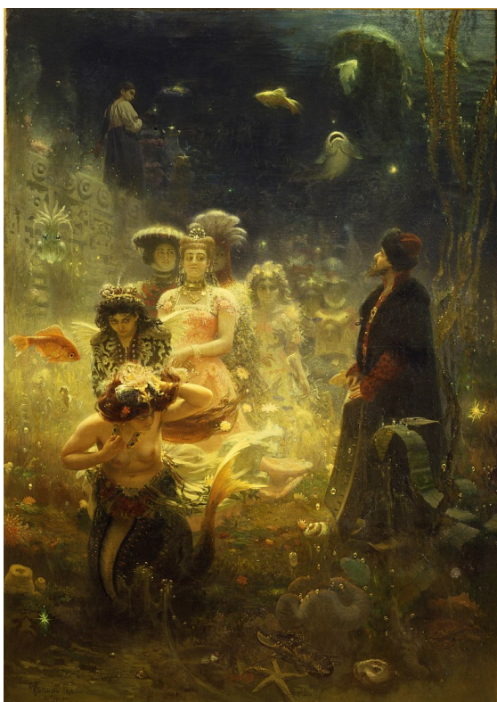
Илья Репин «Садко», 1876 год. Государственный Русский музей, Санкт-Петербург