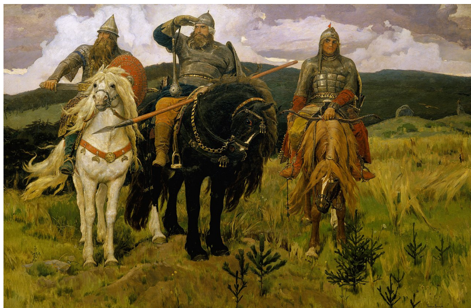
Виктор Васнецов «Богатыри», 1889 год. Государственная Третьяковская галерея, Москва