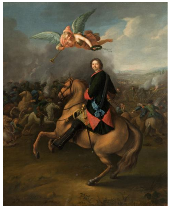
Иоганн Готфрид Таннауер «Петр I в Полтавской битве», 1724 год. Государственный Русский музей, Санкт-Петербург.