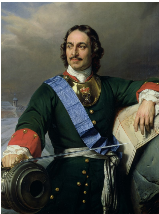
Поль Деларош «Петр Великий», 1838 год.