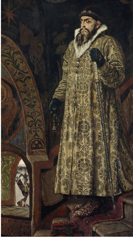
Виктор Васнецов «Царь Иван Васильевич Грозный», 1897 год. Государственная Третьяковская галерея, Москва.