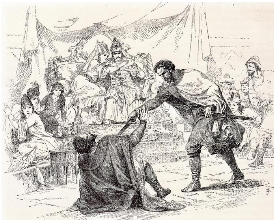
Перед Вами – убийство князя Московского.