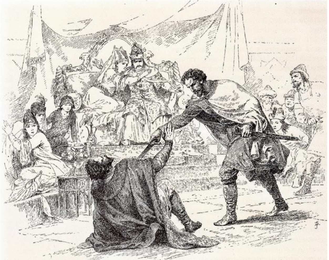
Перед Вами – убийство князя Московского