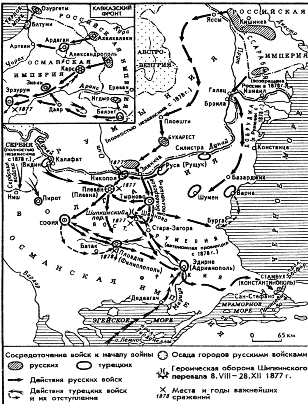
Русско-турецкая война 1877-1878 гг.