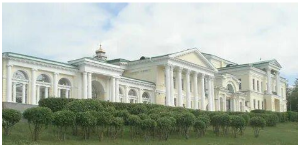
Усадьба Расторгуевых – Харитоновых в Екатеринбурге.

9.1. На территории каких современных городов Свердловской области расположены заводы, упомянутые в отрывке из сочинения А. фон Гумбольдта?