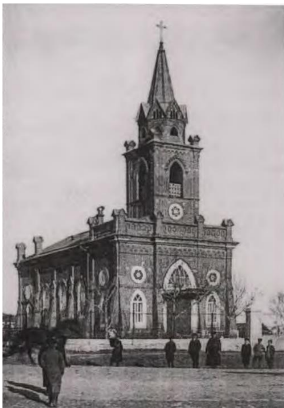
Здание Польского костёла. Свердловск.