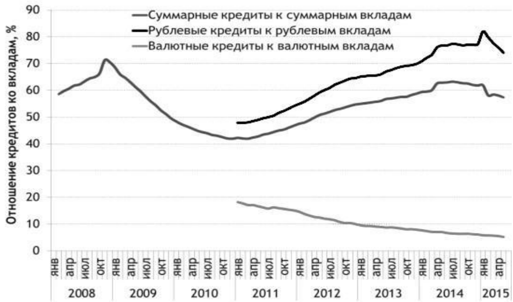
Суммарные кредиты к суммарным вкладам

Отношение объемов кредитов к депозитам населения на начало месяца, 2008–2015 годы, % (сезонно скорректированные ряды)