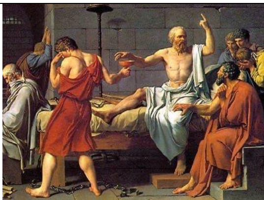
Сократ (469 – 399)