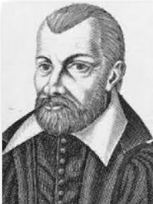
Жан Боден (1530-1596)