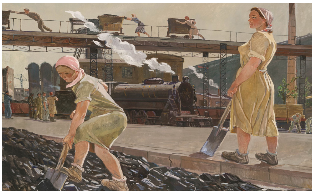
Дейнека А.А. «Донбасс» (1947)